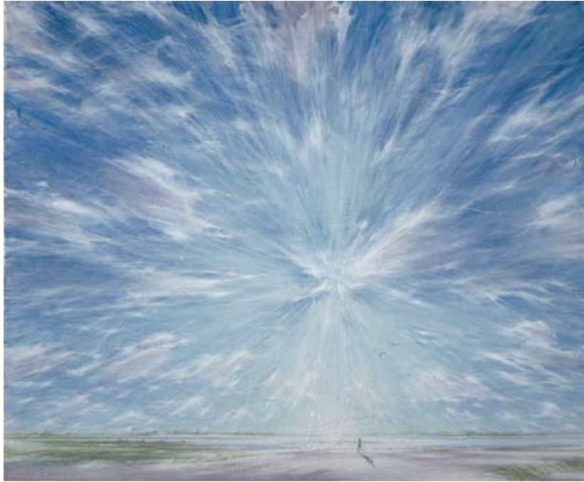
Schilderij van Willem den Ouden uit 2006.

wijoorgaans niet zien: bijvoorbeeld hoe een waterdruppel precies valt. Of dat de lucht ‘vol ingekleurde kleuren’ is.